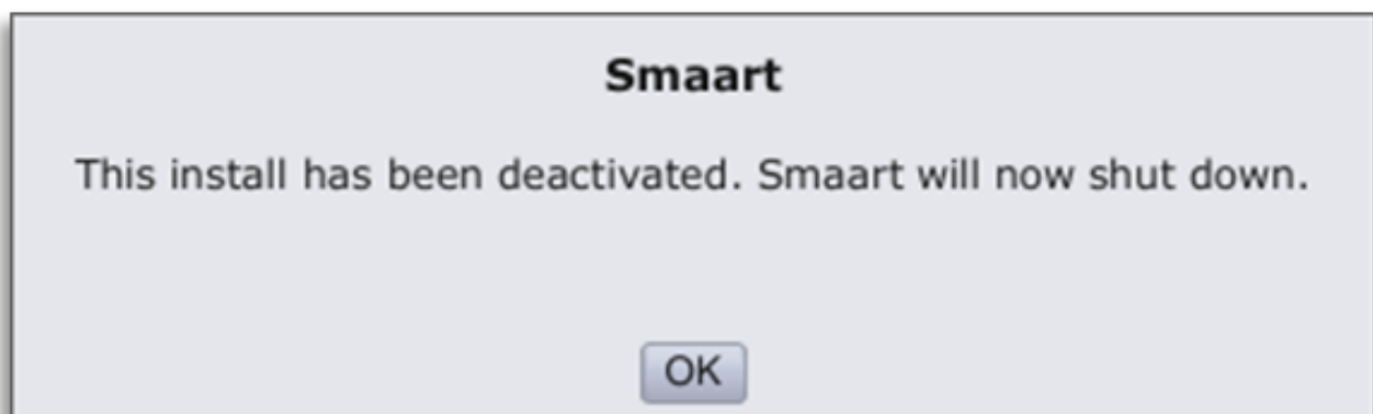
Figura 2: Desativação com sucesso

Depois de clicar em "Deactivate This Installation Now", Smaart irá entrar em contato com os nossos servidores e fará a desativação. Caso ocorra a correta desativação, uma janela aparecerá confirmando-a (Figura 2).