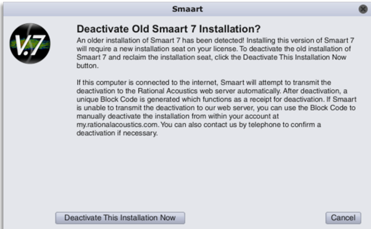
Figura 1: Diálogo de Desativação

instalação antiga do Smaart 7 para que você possa usar a vaga para a instalação da versão 7.4.